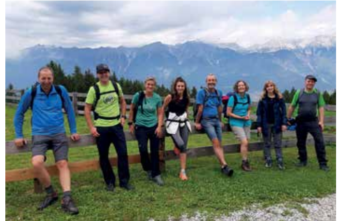
Begleiteter Erfahrungsaustausch in der Natur