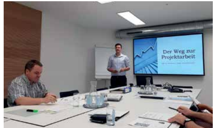
Präsentation der Projektarbeiten 2019