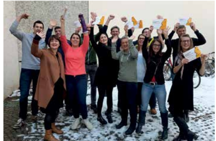
Motivation und Begeisterung als Schlüssel zum Erfolg