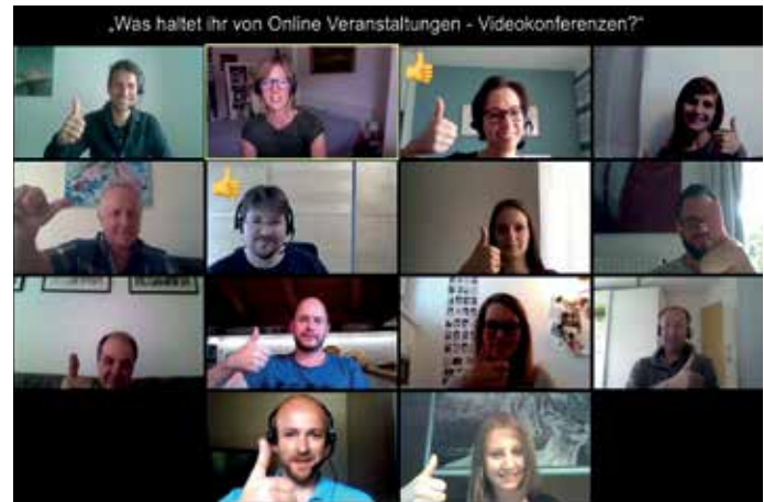
Jetzt neu: Online Seminare via Videokonferenz