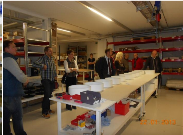
Führung durch die neuen Hallen der Firma planlicht