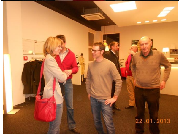
Gemütlicher Ausklang mit regem Austausch.....