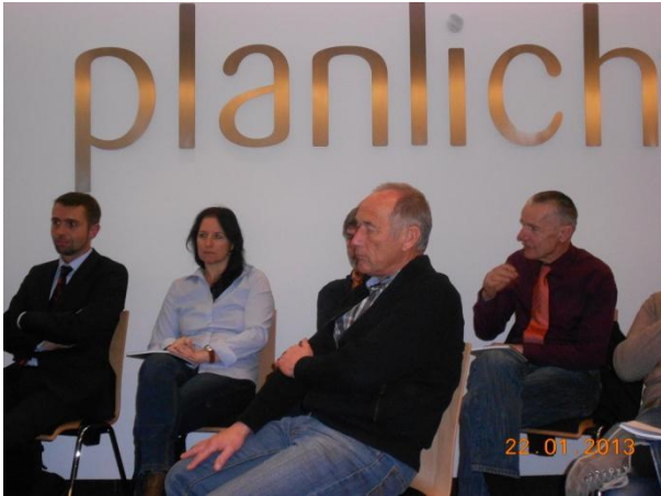
Fragen an die Diskussionsleiter und an die Lehrlinge zum Thema „Motivation“